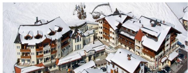
Hotel Edelweiss / Großarl, Austragungsort 38. Wintertagung 2017

Die 38. Wintertagung des Güteverbandes Transportbeton findet von 15.-19.1.2017 in Großarl / Salzburg statt. Austragende Landesgruppe ist die Landesgruppe Niederösterreich / nördl. Burgenland. Das Programm für die Wintertagung konnte bereits weitestgehend fertiggestellt werden. Die Einladungen werden Mitte November 2016 verschickt.